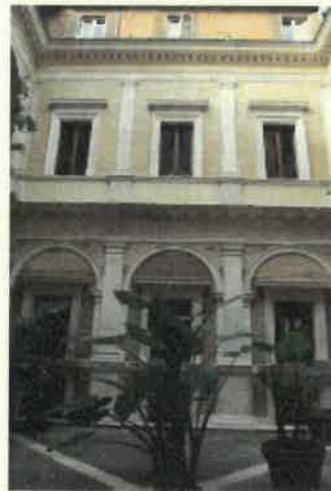
Palazzo Baldassini - Roma

2012 PROGETTAZIONE DEFINITIVA ED ESECUTIVA per Conto di Cliente Privato relativamente alla "Restyling di villa sita in Sonnino (LT)" - Classe e categoria prestazione tecnica L.143/49 "I/c", DM 18/11/1971 "I/b"- Importo dei lavori € 200.000,00.