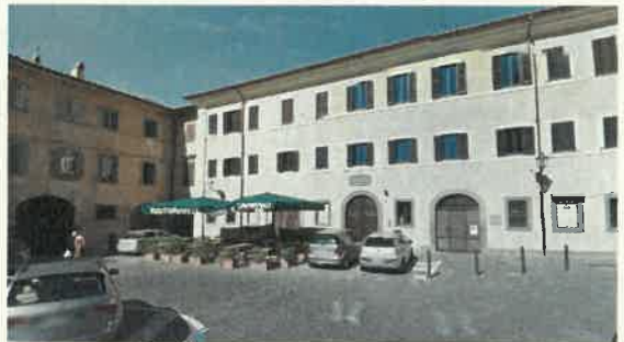
Eco Albergo - Palazzo Odescalchi Bracciano

2016-2017 ACCATASTAMENTO PLESSI SCOLASTICI "Asilo nido, scuola media L. da Vinci e scuola elementare e materna di capocroce", per conto del Comune di Sonnino - Classe e categoria prestazione tecnica L.143/49 "I/c", DM 18/11/1971 "I/b".