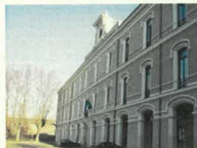
Palazzina Capocci - Roma

2006/2009 PROGETTAZIONE DEFINITIVA ED ESECUTIVA, DIREZIONE LAVORI per Conto della I.A.C.E. SpA di Roma e Ministero per i Beni e le Attività Culturali - Dipartimento Sport e Spettacolo relativamente ai "Lavori di