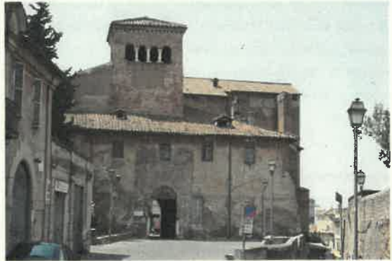
Basilica Santi Quattro Coronati - Roma

2011/2012 COORDINAMENTO SICUREZZA IN FASE DI ESECUZIONE per Conto del Ministero per i Beni e le Attività Culturali - Direzione Regionale per i Beni Culturali e Paesaggistici per il Lazio relativamente ai "Lavori di di rifacimento delle coperture e risanamento interno della Chiesa di San Cosimato in Roma". Categoria Lavori OG2 - Classe e categoria prestazione tecnica