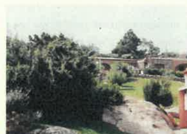
Residence Liscia di Vacca - Porto Cervo