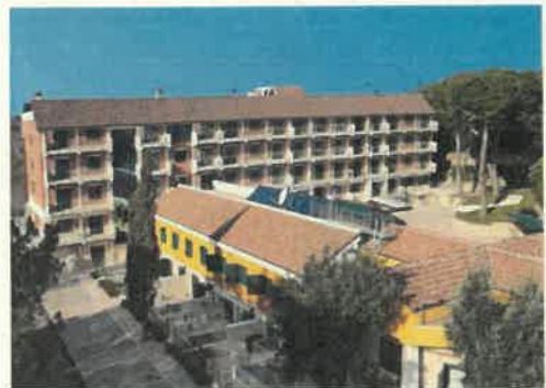
Complesso della Fanella - Roma

2012 DIREZIONE CANTIERE per Conto della EDIL GM di Roma relativamente