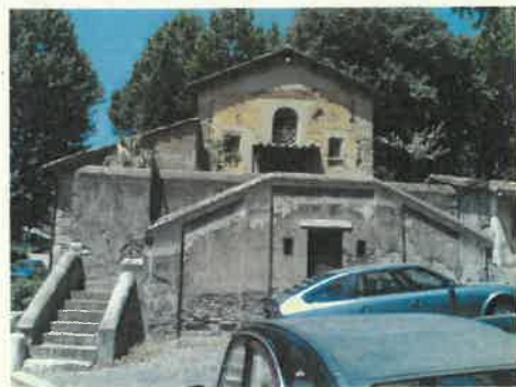
Santa Passera - Roma

2008 PROGETTAZIONE PRELIMINARE, DEFINITIVA, ESECUTIVA E COORDINAMENTO SICUREZZA per Conto del Comune di Sonnino relativamente alla "Messa in sicurezza della Scuola Media Leonardo Da Vinci, art. 80 comma 21 Legge 27/12/2002 n.289". Classe e categoria prestazione tecnica L.143/49 "I/d", DM 18/11/1971 "I/b"- Importo dei lavori € 425.000,00.