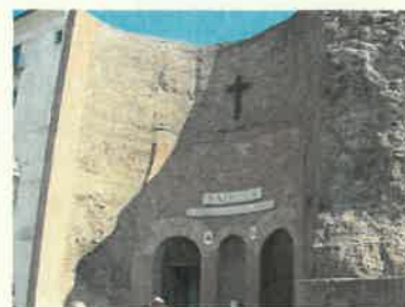
Santa Maria degli Angeli - Roma

2003/2004 DIREZIONE LAVORI per Conto della società Ville liscia di Vacca srl per "Lottizzazione Miata e Realizzazione 4 Villini bifamiliari nei lotti A25, A26, A27, A28" Località Arzachena Porto Cervo. Categoria Lavori OG1, OG6 - Classe e categoria prestazione tecnica L.143/49 "I/d", DM 18/11/1971 "I/b"- Importo dei lavori € 1.792.762,00.