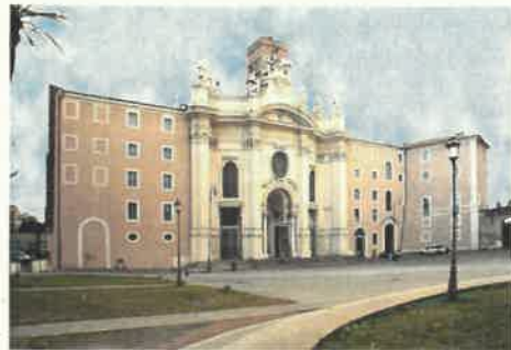
San Croce in Gerusalemme - Roma

2006/2009 PROGETTAZIONE DEFINITIVA, ESECUTIVA E COORDINAMENTO SICUREZZA per Conto del Condominio Gandola - Via del Casale di San Pio V 15/I relativamente alla "Manutenzione esterna condominio, realizzazione ascensore interno e realizzazione garage interrato con montauto