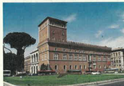
Palazzo Venezia - Roma