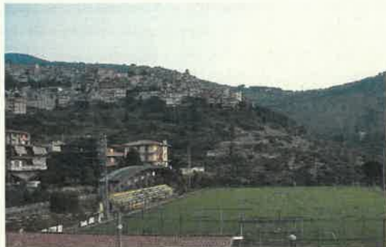
Campo Sportivo San Bernardino - Sonnino